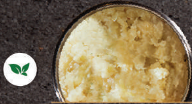
Chopped Garlic 마늘 蒜蓉浇头