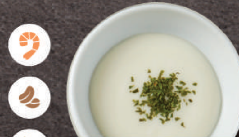
Coconut Yogurt Sauce 코코넛 요거트 소스 椰子酸奶酱