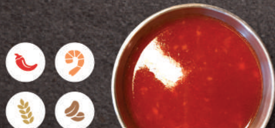
Hot Barbecue Sauce 핫 바베크 소스 辣烤酱