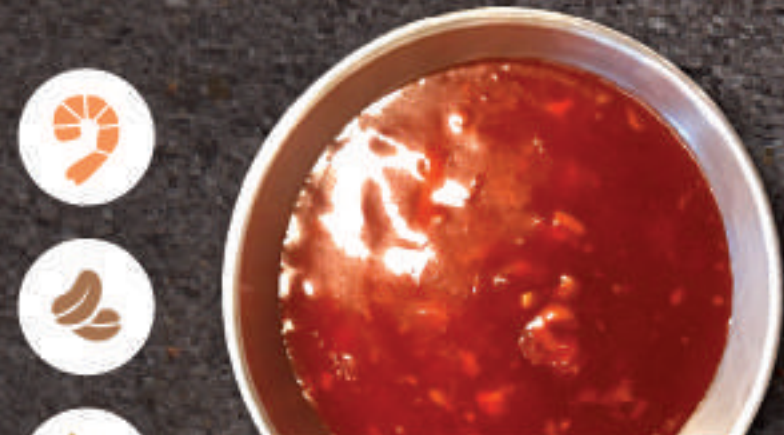
Sweet & Chili Sauce 양념 소스 甜辣酱