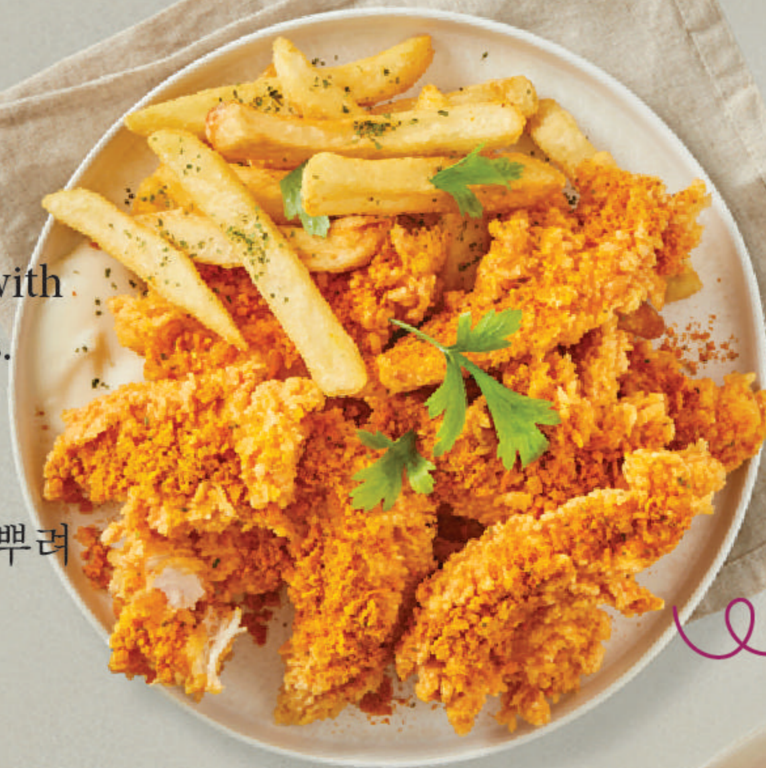
BC06 Chicken Tenders 순살(안심) 鸡柳块