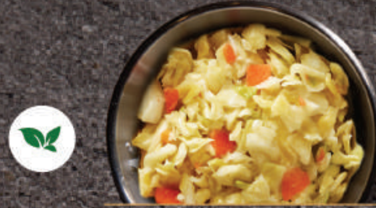
Coleslaw 코울슬로 凉拌卷心菜