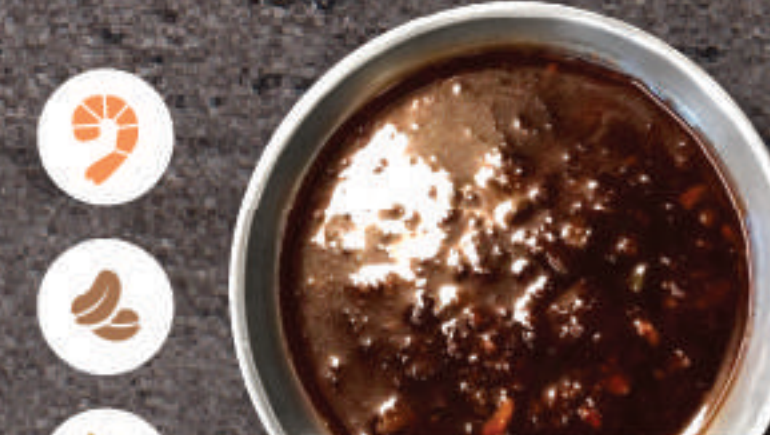
Garlic Soy Sauce 마늘간장 소스 酱油蒜香酱