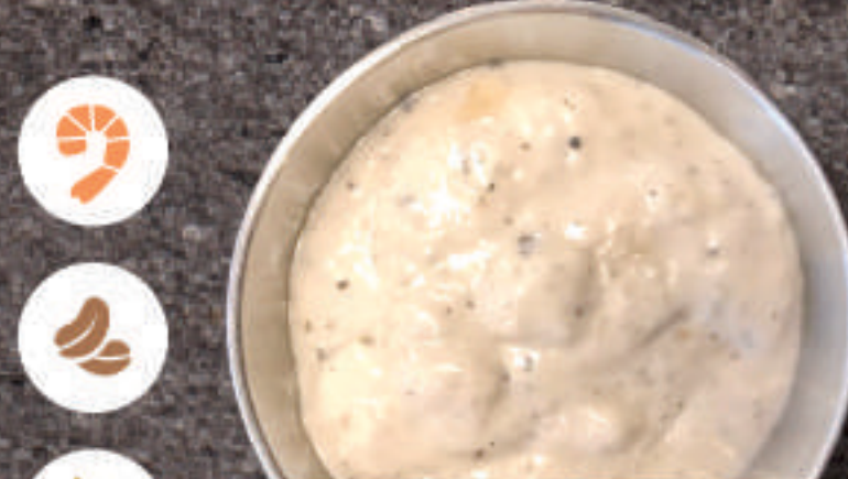
Onion Sauce 어니언 소스 洋葱酱