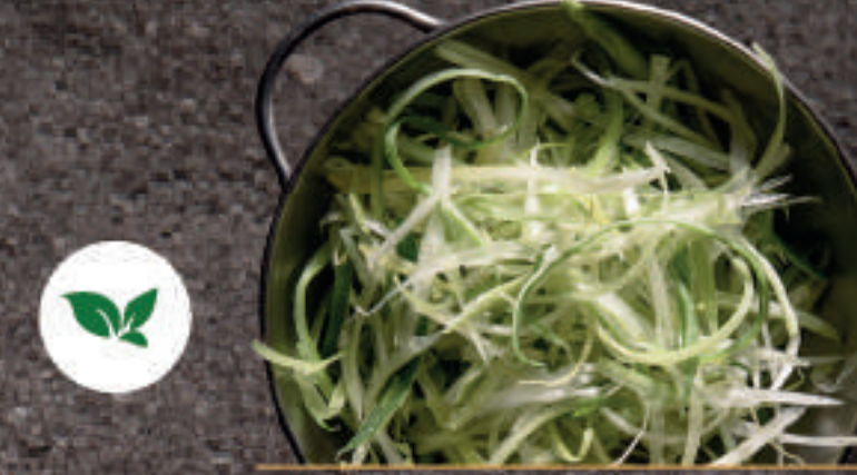
Green Onion 파 葱丝